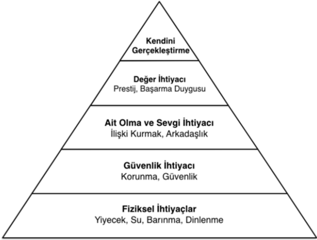
Şekil 2. Maslow'un İhtiyaçlar Hiyerarşisi ( www.psikonot.com ) (Aktaş,2018:48).

Şekil 2'de görüldüğü gibi bireyin ihtiyaçları en alttan en üste doğru şu şekilde sıralanmaktadır (Aktaş, 2018:48):